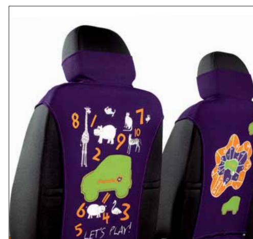
Pettorine multifunzionali su sedili anteriori.

Immagina una Panda che faccia da mamma ai tuoi bambini. Come Panda Mamy. Un'auto piena di attenzione nei loro confronti, ma pronta a coccolare anche te con soluzioni intelligenti. Perché è un'auto pratica e piacevole da guidare grazie alle sue dimensioni compatte e alla posizione di guida alta che domina la strada. Numerose le idee dedicate ai tuoi cuccioli, a partire dallo specchietto per controllarli, agli attacchi per le borse nel portabagagli, fino ad arrivare alle pettorine colorate multifunzione e ai sedili lavabili a prova di merendine. Ci voleva, no?