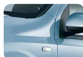
792 Azzurro Settimo Cielo Metallizzato