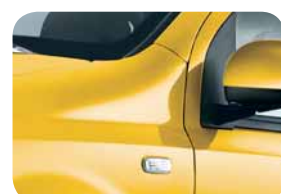
509 Giallo Birichino Pastello