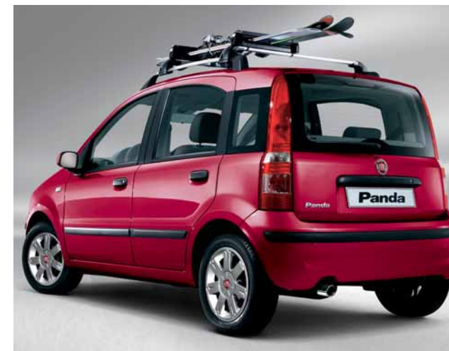
Barre portatutto Free Carver.