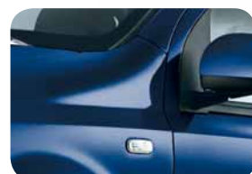
475 Blu Bastian Contrario Pastello