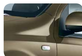
633 Beige Spumeggiante Metallizzato