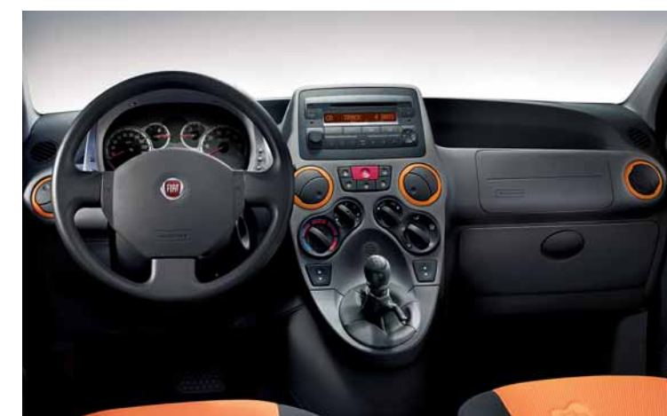
Tessuto lavabile per sedili e pannelli. Mostrine bocchette verniciate.