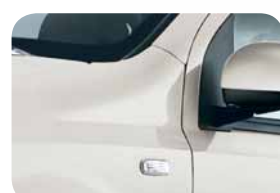
270 Bianco Gioioso Vernice Tristrato