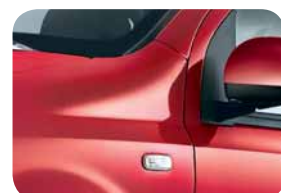
111 Rosso Sfrontato Pastello