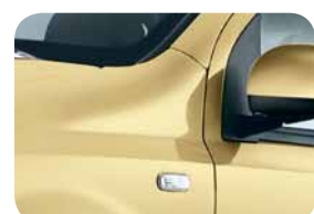
541 Giallo Ottimista Pastello