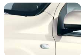
268 Bianco Bianco Pastello