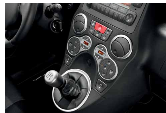
Mostrine color alluminio.