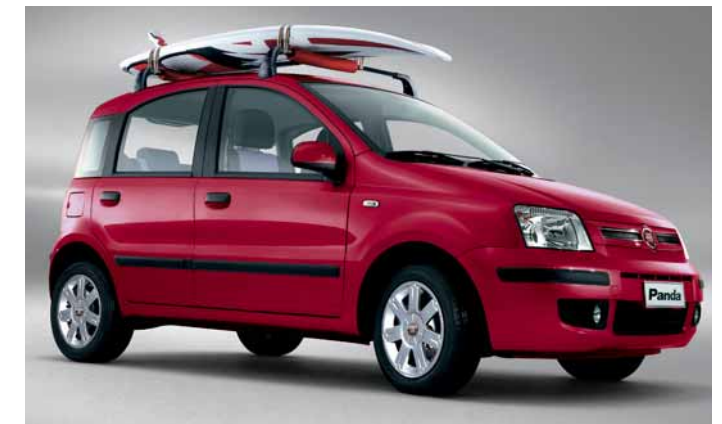
Barre portatutto Surf Rider.