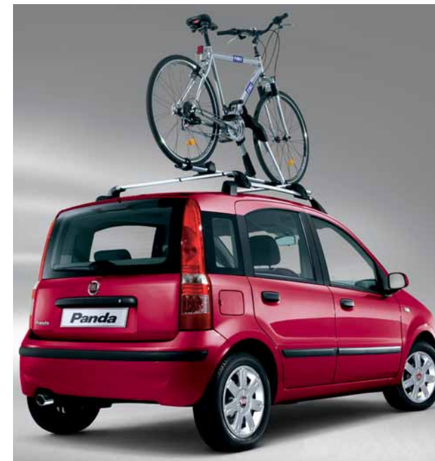
Barre portatutto Bicycle.

Alcune proposte di personalizzazione disponibili sulla nuova Panda.