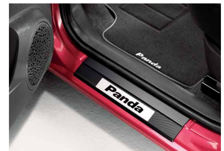
Tappetini e batticalcagno.