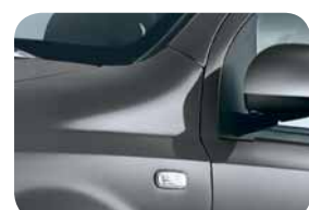
695 Grigio Sfenato Metallizzato