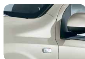
612 Grigio Perbene Metallizzato