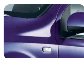
154 Mirtillo Monello Metallizzato