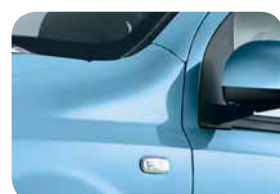
952 Azzurro Volare Pastello