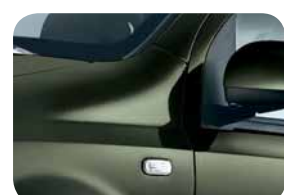
370 Verde Eccentrico Metallizzato