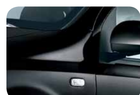
876 Nero Provocatore Metallizzato