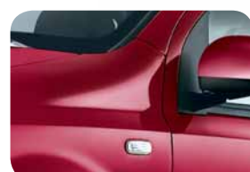
705 Rosso Arzillo Metallizzato